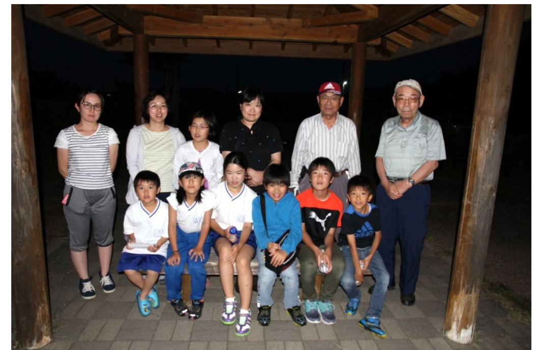
↑ 6月30日 午後7時46分撮影の集合写真

(2回で周辺の子供達延べ30人弱の参加を得ました。)ホタルは例年ほど見られませんが観察することができました。子供たちも例年に比べて参加が少なかったかな。子供たちの中には初めてホタルとの出会いに感動する子もおりそれなりに成果がありました。その年の様々な気象等環境変化や観察時期でホタルの数にも変化があるのかなと感じているところです。