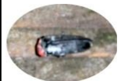
←クモの巣に絡まって光っていたゲンジホタルを捕獲