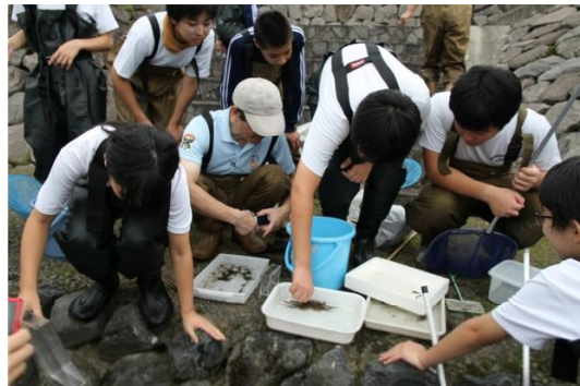
一ノ関駅東口付近での観察状況