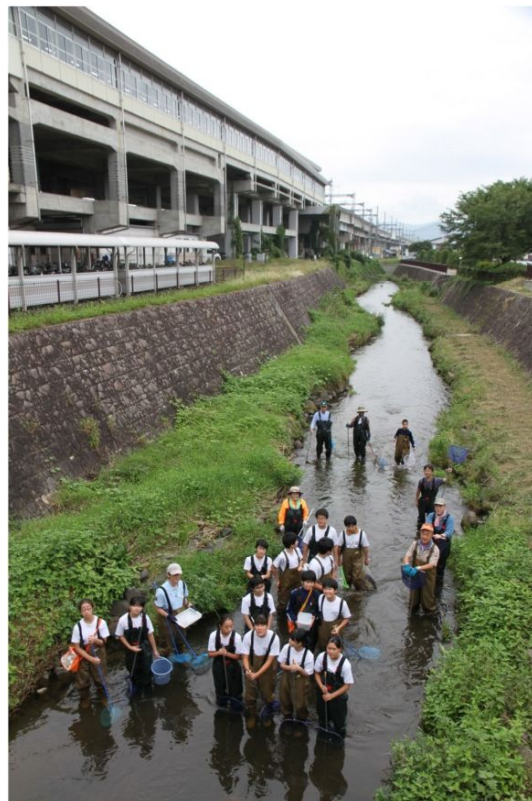
観察を始めて間もなく、一関テレビも取材に来てくれました。