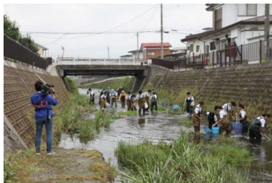
採取したモクズガニを観察中